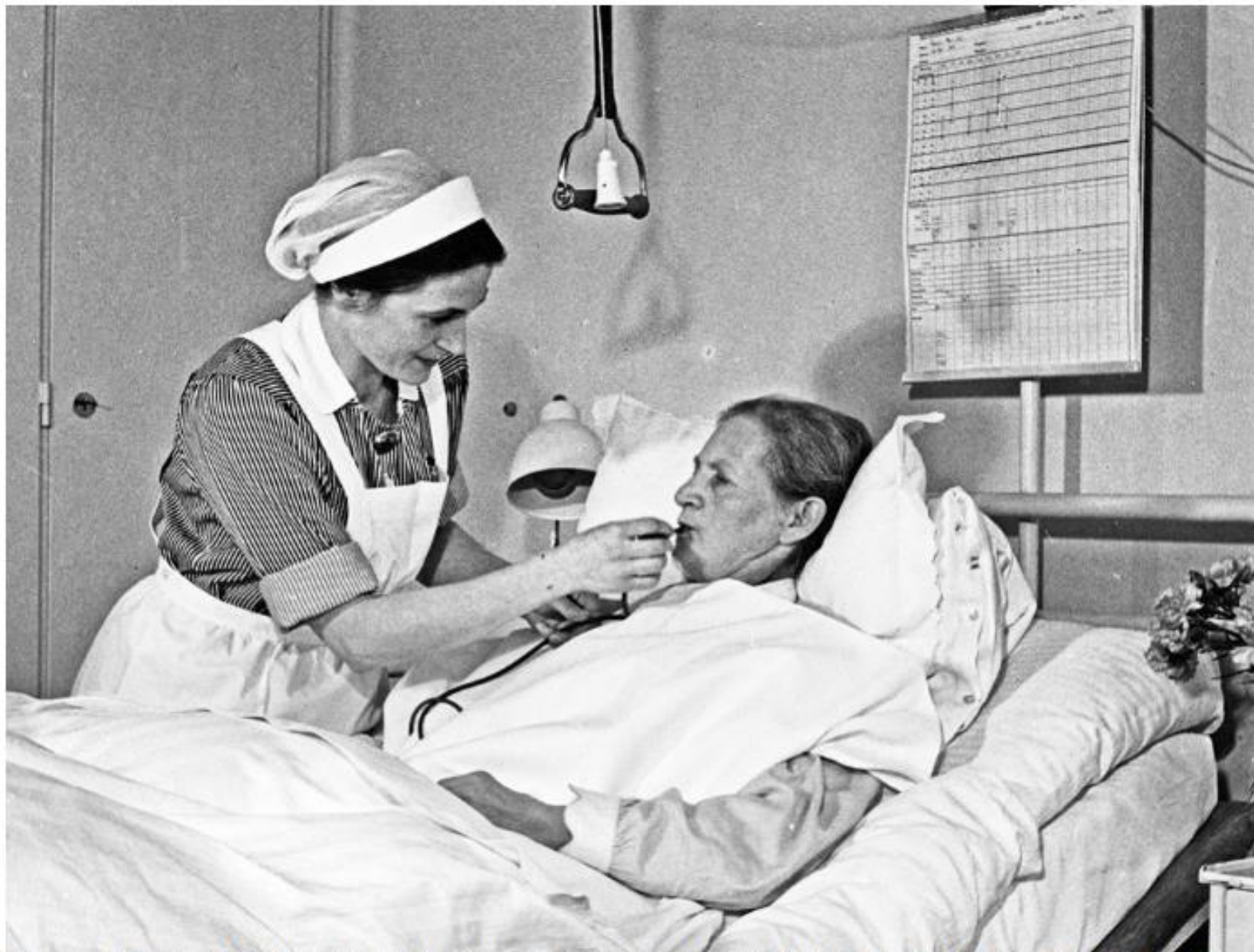
Schwester und Patientin im Zürcher Frauenspital um 1925.