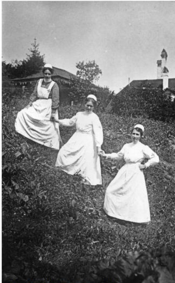
Totale Verfügbarkeit und die Bereitschaft, eigene Bedürfnisse zurückzustellen, wurden erwartet. Diplomierte Krankenschwestern um 1920.