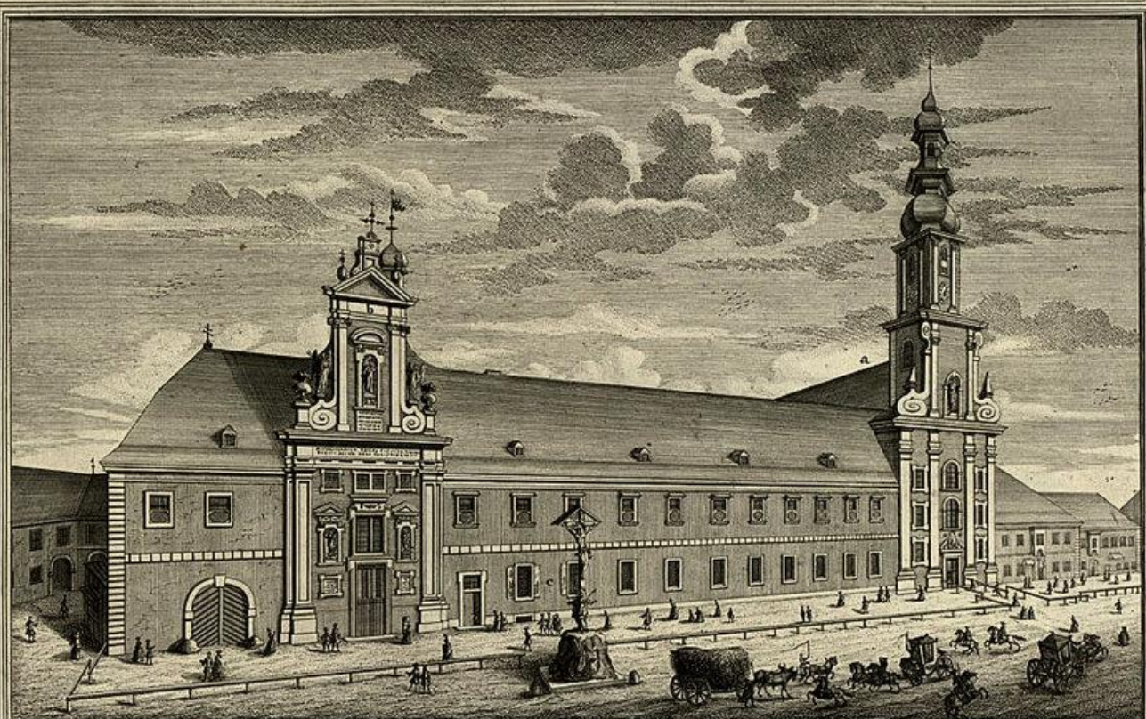
Templum S. IOANNIS BAPTISTAE et Novocommum Erubrum S. Joannis Dec. vulgo Pratum Misericordiae in civitate Lipsiana, ab Imp. Ferdin. II. erectum A. 1622. et perfectum A. 1652. a. Templum. b. Novocommum. c. Pharmaceopolium.