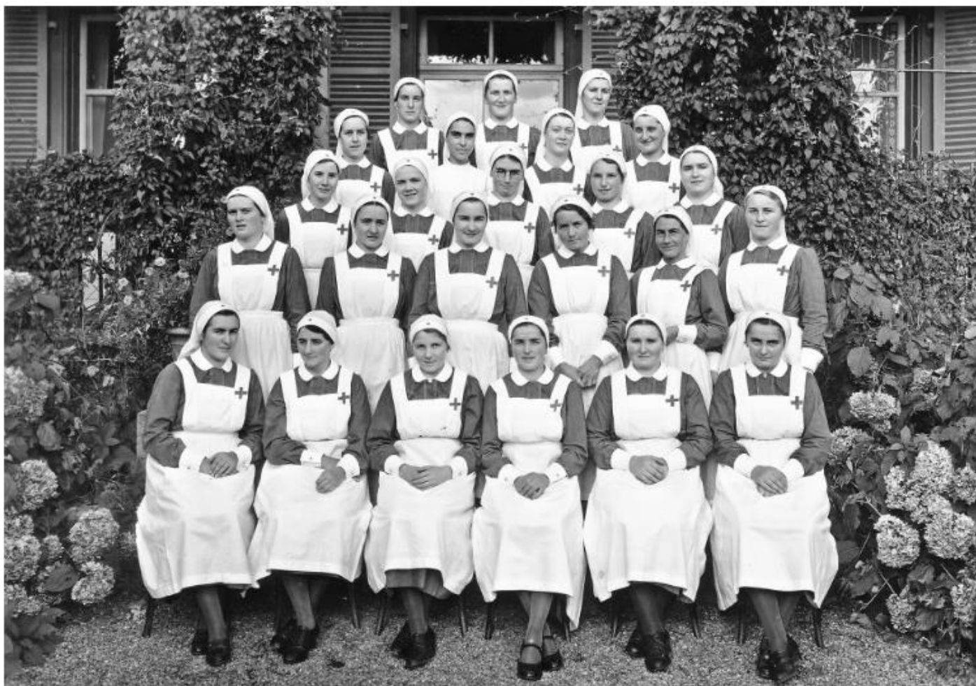
Hatten im Kriegsfall die Verwundetenpflege sicherzustellen: Schülerinnen der Rotkreuz-Pflegersinnenschule Lindenhof in Bern um 1935.