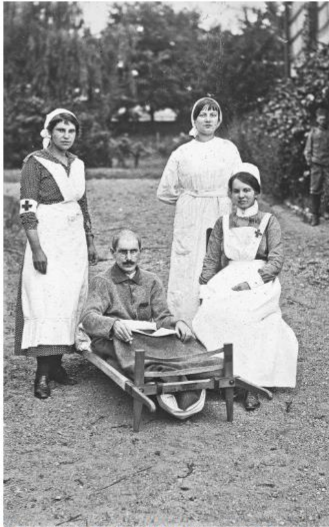
Einsatz im Ersten Weltkrieg: Schweizer Rotkreuzschwestern in Böhmen, 1916.